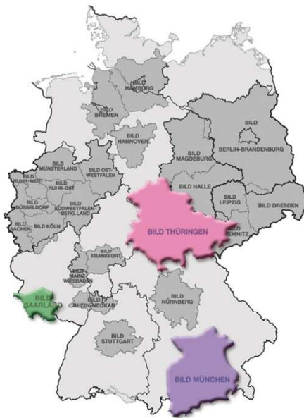
Beispiel: 3 Ausgaben = 15%