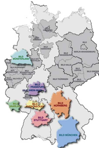
Beispiel: 7 Ausgaben = 30%

Preise lt. Preisliste Nr. 66; zzgl. MwSt.; Das Angebot ist abschlussfähig gemäß Preisliste und AE-fähig. Die stark ermäßigten Festformate in Bremen, Köln, Saarland, München und Dresden sind von dieser Aktion ausgenommen. (Die Belegung dieser Ausgaben erhöht aber ggfs. den Rabatt.) BILD HAMBURG und BILD BERLIN-BRANDENBURG sind von der Aktion ausgenommen.