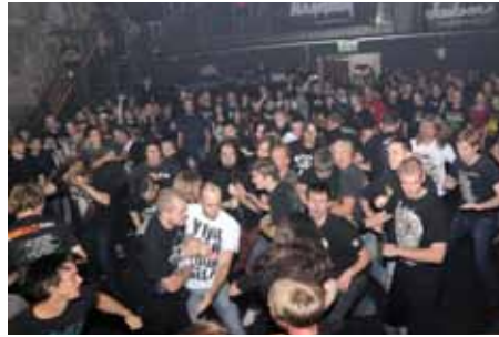
Mosh-Pit vor der Bühne