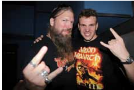
Johan Hegg (Amon Amarth) & Paul Biedermann (Schwimmweltmeister)