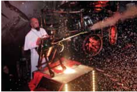
Die Apokalyptischen Reiter feiern ihr Live-Programm ab