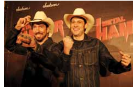
The Boss Hoss auf dem schwarzen Teppich