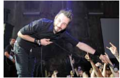
Caliban live bei den METAL HAMMER Awards 2011