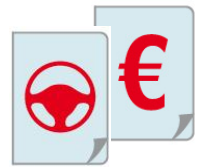
BILD am SONNTAG PKW-Versicherungswechsel-Journal 2011 Daten und Fakten