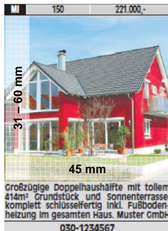
Foto XXL Kopfzeile + bis zu 5 Zeilen Die Höhe des Fotos kann zwischen 31 mm – 60 mm variieren.